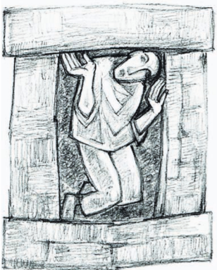
Ps. 25:16-17. KEER U TOT MIJ EN WEES MIJ GENADIG. IK BEN ALLEEN EN ELLENDIG. MIJN HART IS VOL VAN ANGST, BEVRIJD MIJ UIT MIJN BENAUVENIS.