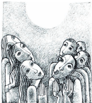
Ps.89-16-17 GELUKKIG HET VOLK DAT VAN UW ROEM GETUIGT EN LEEFT, HEER, IN HET LICHT VAN UW GELAAT.